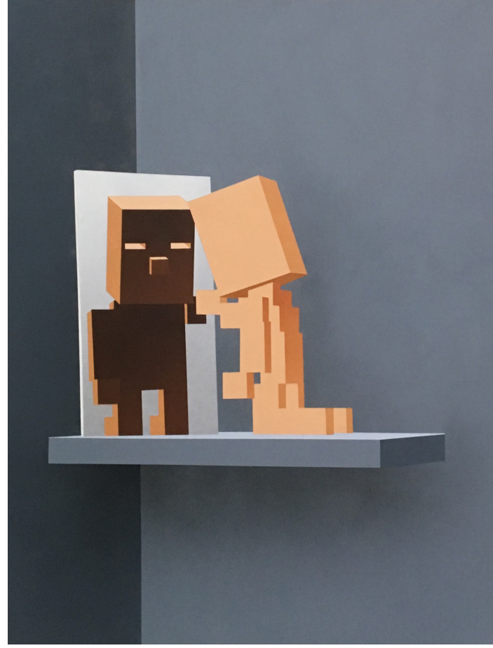
HUB, peinture acrylique et spray sur toile, 150x10cm, 2019 © Sépand Darnesh Sunset - Rs, Besançon