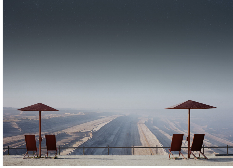
Photographie extraite de la série « Titans », 2019 © Laurent Pernot - ADAGP Paris espace 36, Saint-Omer