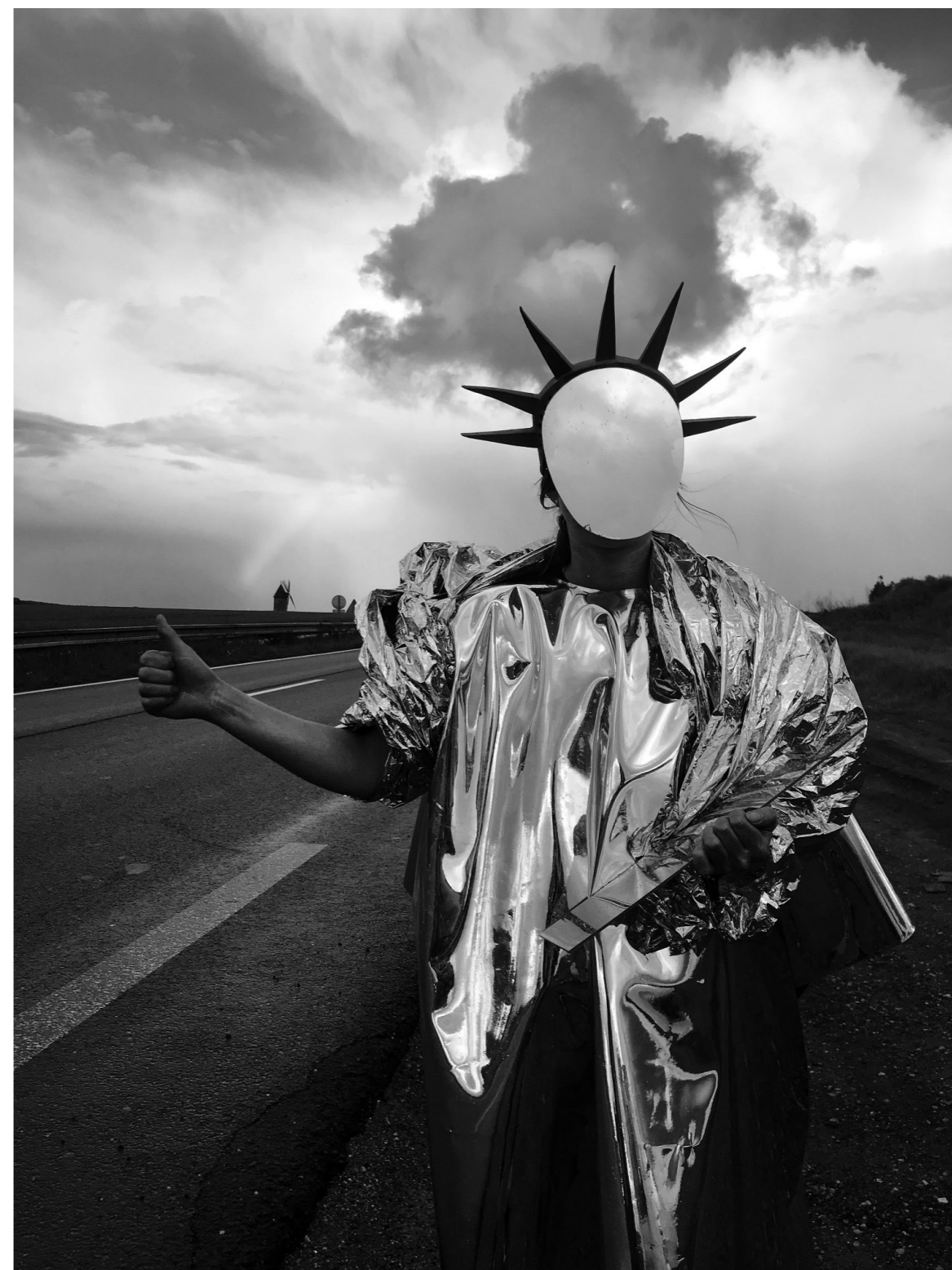
Marianne Villière Face to our Liberty, performance, 2021.