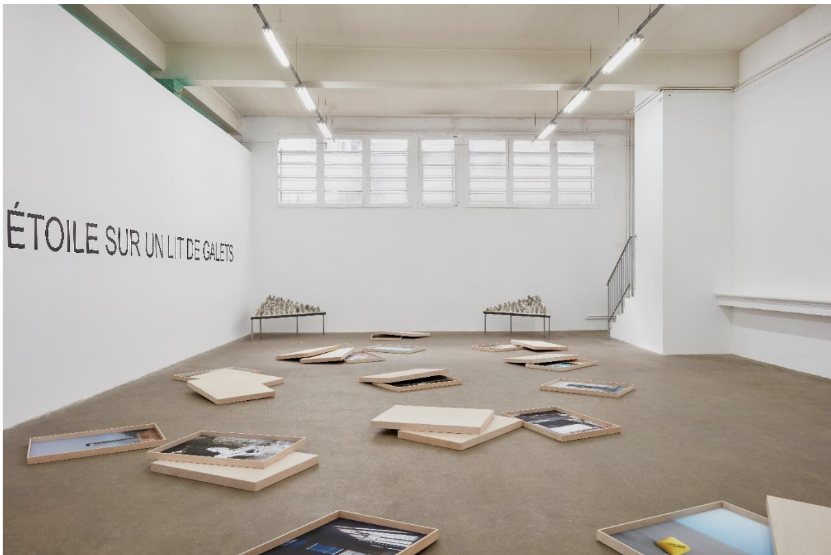
Photographies de l'exposition "Dormir à la belle étoile sur un lit de galets", Doc, 18-26 septembre 2021.

A l'occasion de l'exposition « Dormir à la belle étoile sur un lit de galets », l'aide aura également permis l'accompagnement par le texte d'un commissaire d'exposition (Léo Marin) et la création d'un podcast dédié à la proposition (Présent·e - Camille Bardin).