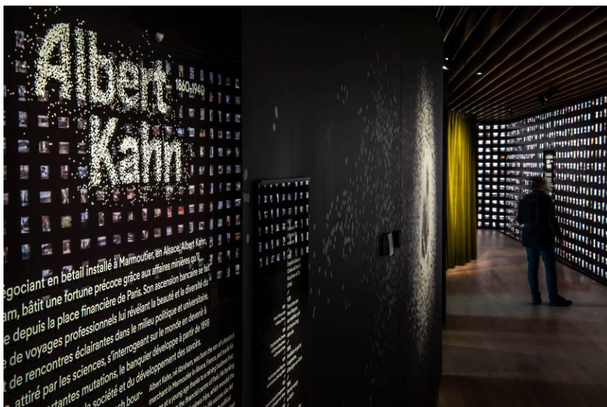
vue de l'exposition permanente

La mobilisation de la dimension spectaculaire inhérente aux modes de diffusion d'origine -l'autochrome comme le film avaient vocation à être projetés, confrontant et juxtaposant images en couleurs et images animées, permettra immersion et émerveillement.