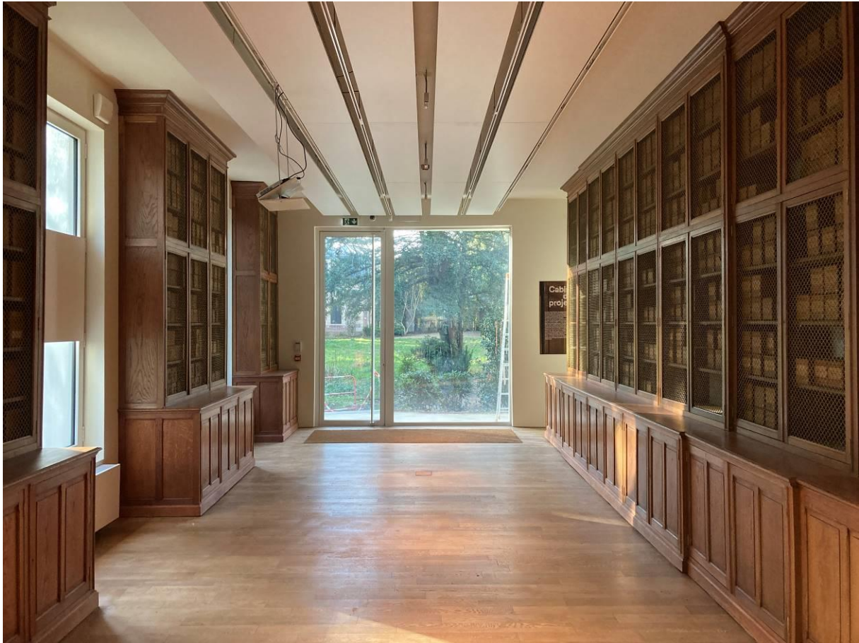
Vue de la salle des Plaques

Intégrée dans le jardin, la salle dite « des Plaques » est le lieu où, à la fin des années 1920, les plaques autochromes produites par les opérateurs des Archives de la Planète étaient classées et conservées. Ce lieu, inscrit dans le parcours de visite du musée, est nouvellement ouvert au public. Aménagé selon le dernier état connu au temps d'Albert Kahn, cet espace est un lieu de mémoire qui rend compte de l'entreprise d'archivage du monde initiée par le banquier.