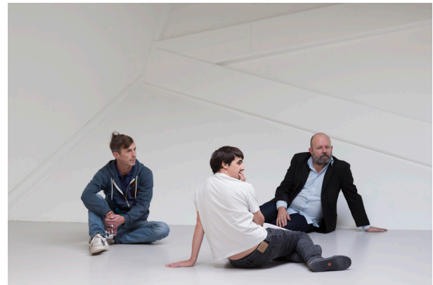
Carole Douillard, The Waiting Room , Performance Frac Mèca, 2023, Courtesy Carole Douillard & ADAGP © Jean-Christophe Garcia