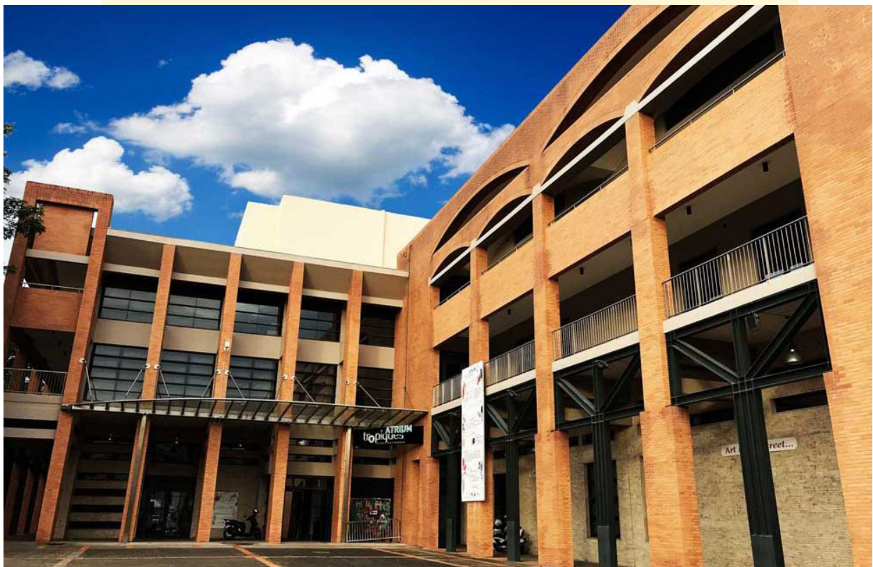
Tropiques Atrium Scène Nationale