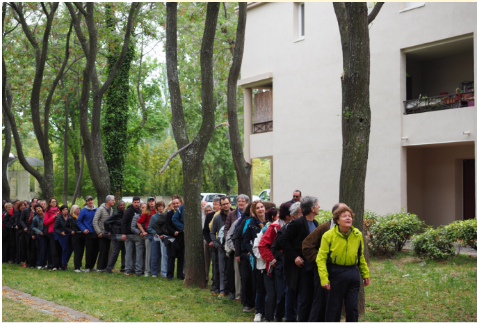
Pantalonnade, Chuglu, 2019 © Victor Aube-Martin