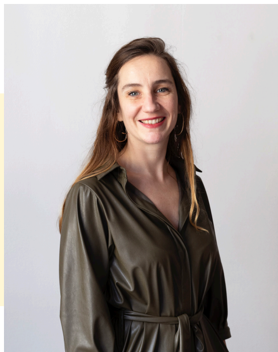
Magalie Meunier © DR