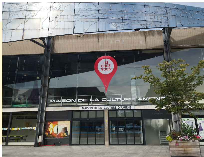
La Maison de la Culture d'Amiens