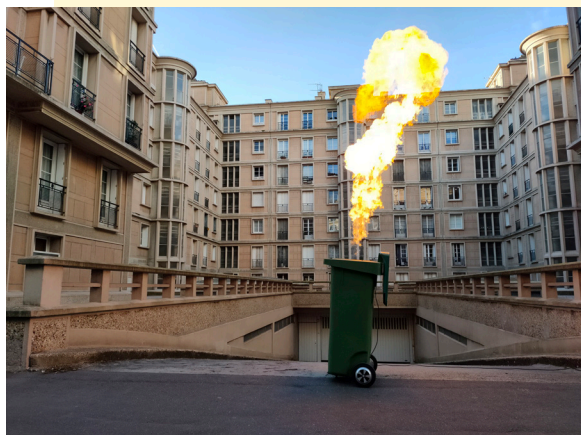
HeHe, image extraite de la vidéo Ballet de la poubelle (2024, 2'36)