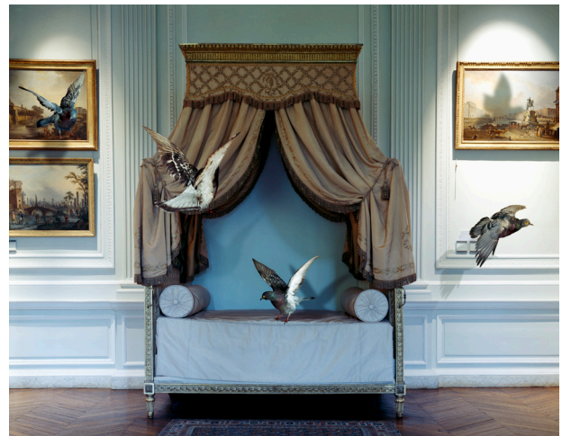
Karen Knorr, The Green Bedroom Louis XVI , Musée Carnavalet, 2005