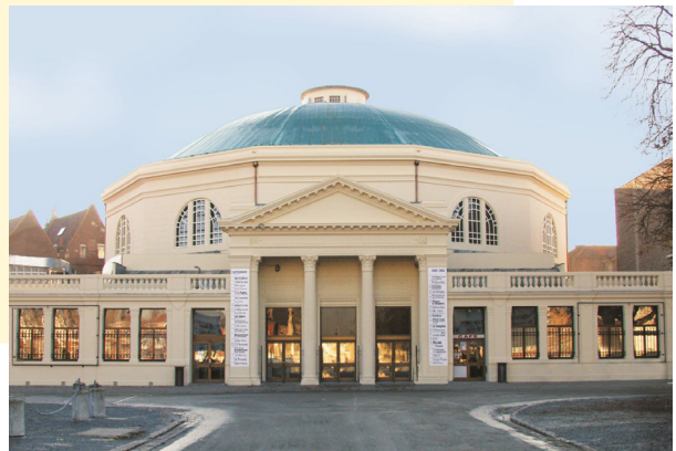
Hippodrome de Douai