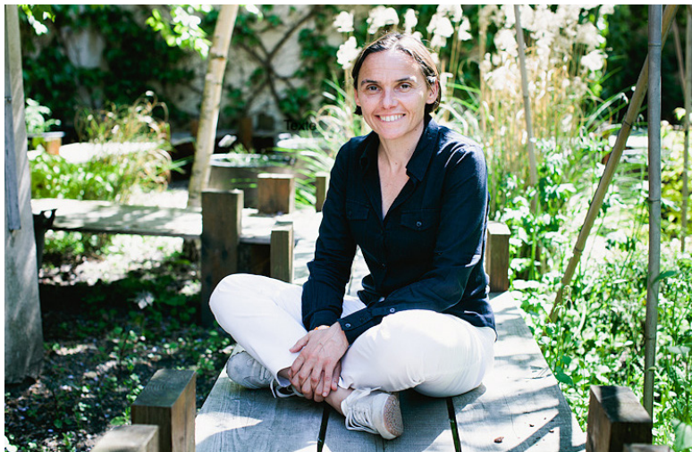
Béatrice Josse © Arno Paul