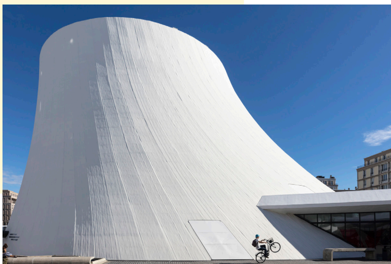
Le Volcan