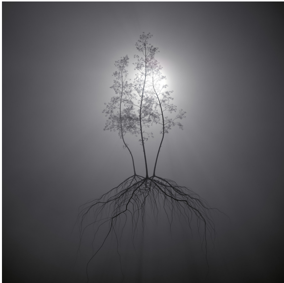
Éden - COLLECTIF MxM - Cyril Teste & Hugo Arcier