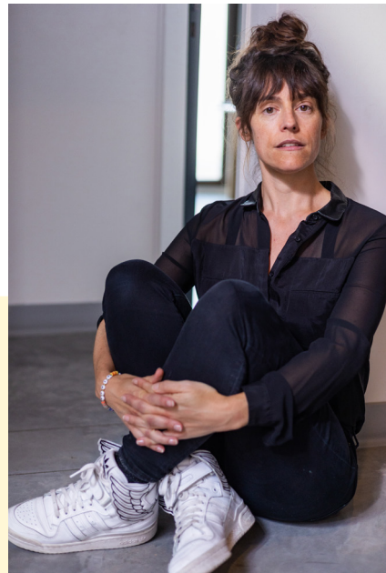
AnneSophie Bérard