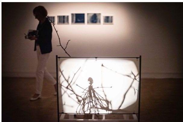
Exposition Une histoire de l'art , Philippe Dupuy