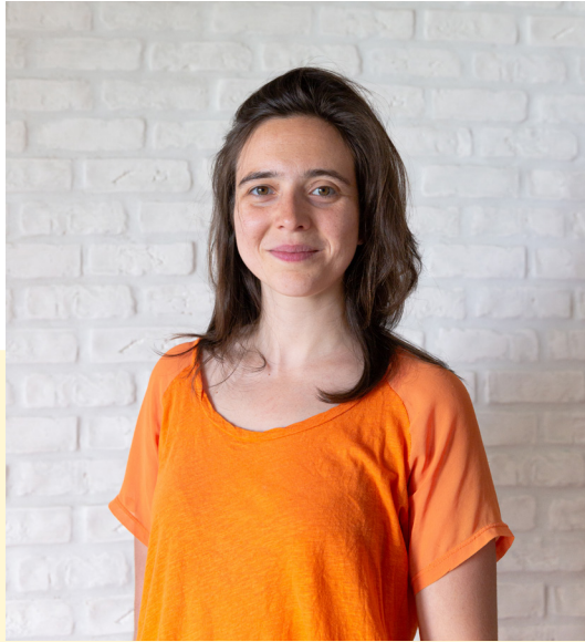
Andréanne Béguin © M.Béguin