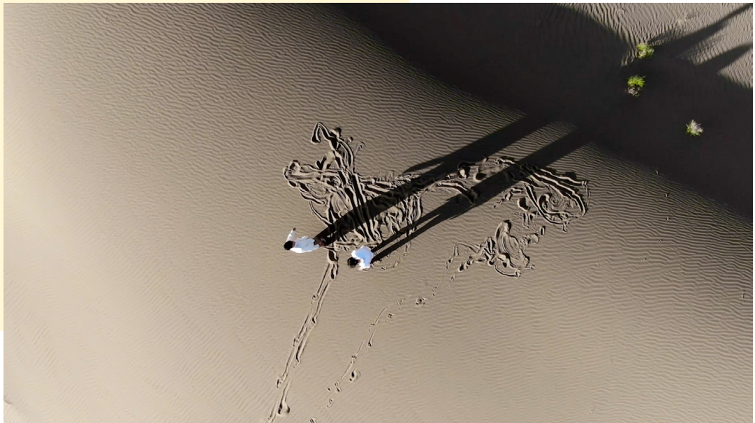
Liu Xin, The White Stone , 2021; Digital Video, 5.1 sound mix or stereo sound 21'57