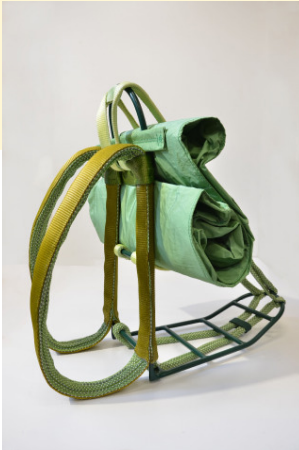
Awena Cozannet, Force Motrice, 2022 © ADAGP