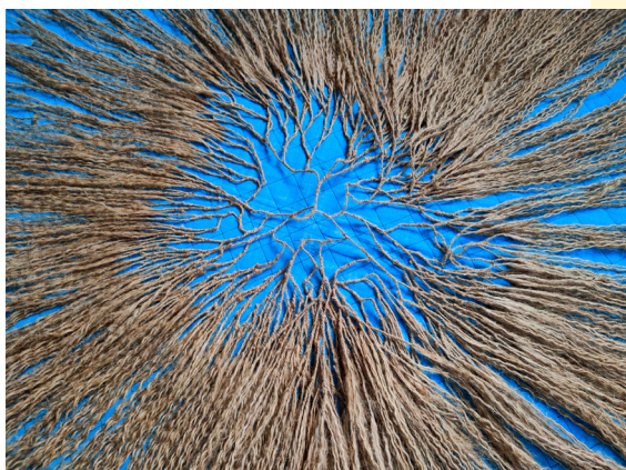
recherches, 2024 © Guillaume Barborini