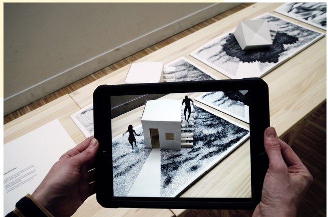
Acqua Alta - La traversée du miroir - Adrien M & Claire B x Brest Brest Brest