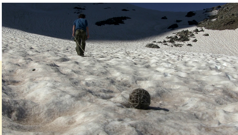
Portée de nos pas, 2021 © Guillaume Barborini