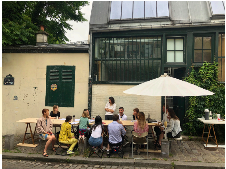
Le collectif Beyond the post-soviet (Btps)