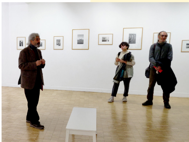
Bernard Plossu, exposition En Égypte le long du Fleuve