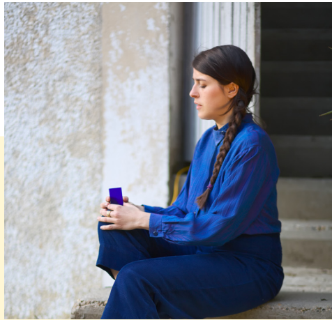
Élise Girardot © Emmanuelle Leblanc