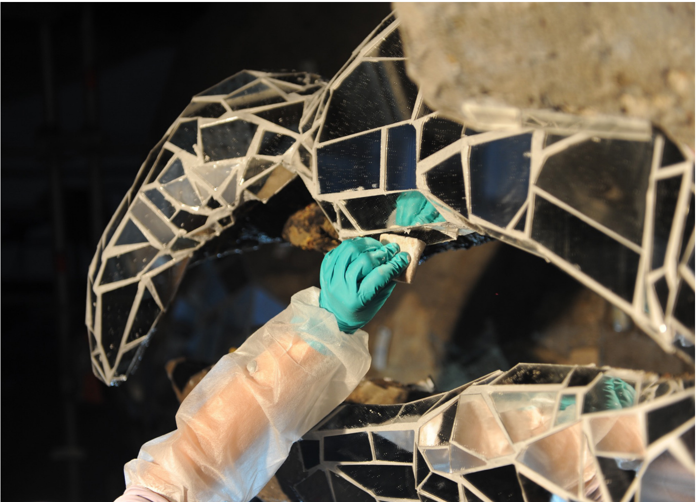
Vues du chantier de restauration de La Face aux miroirs