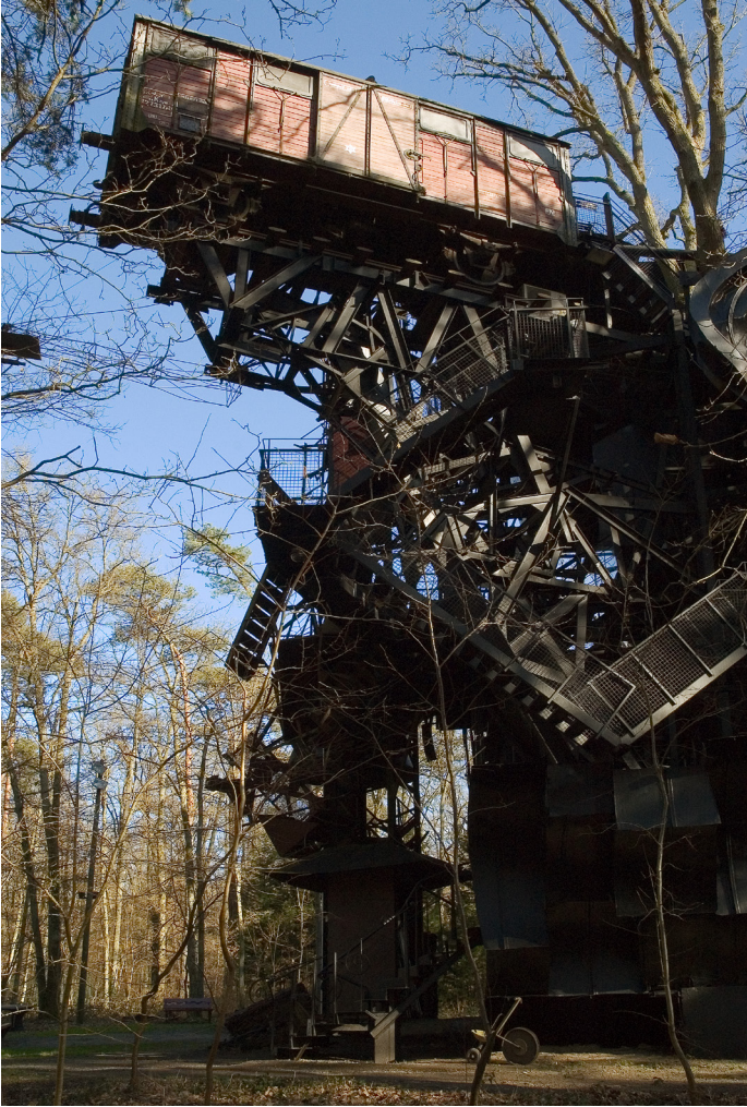
L'Hommage aux déportés, Eva Aeppli

La seconde opération significative se situe au niveau de l'Hommage aux déportés d'Eva Aeppli. Évocation des désastres de la Shoah, l'œuvre se compose d'un wagon de la SNCF des années 1930 suspendu sur une plateforme à plus de 13 mètres de haut, à l'intérieur duquel se trouvent 15 figures en soie blanche et velours marron. Très dégradé, le wagon a été restauré à l'identique après le traitement des lames de bois endommagées. Son isolation thermique et le remplacement de la climatisation à l'intérieur du wagon permettent de maintenir les sculptures dans un climat suffisamment stable pour leur bonne conservation.