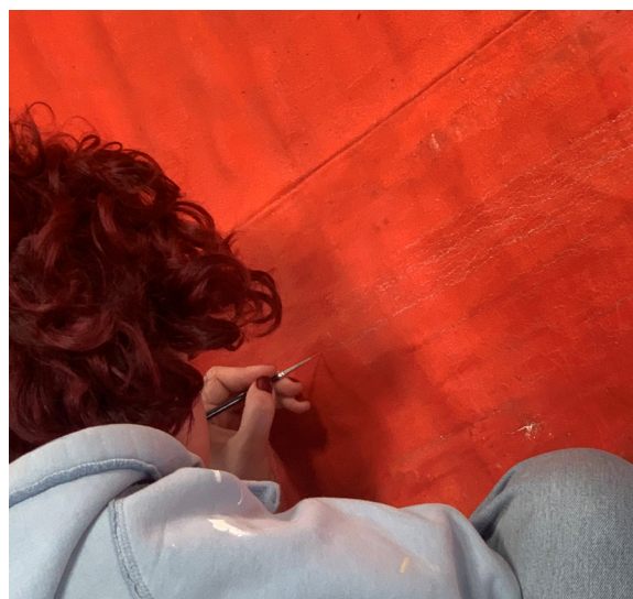
Restauration de la couche picturale.