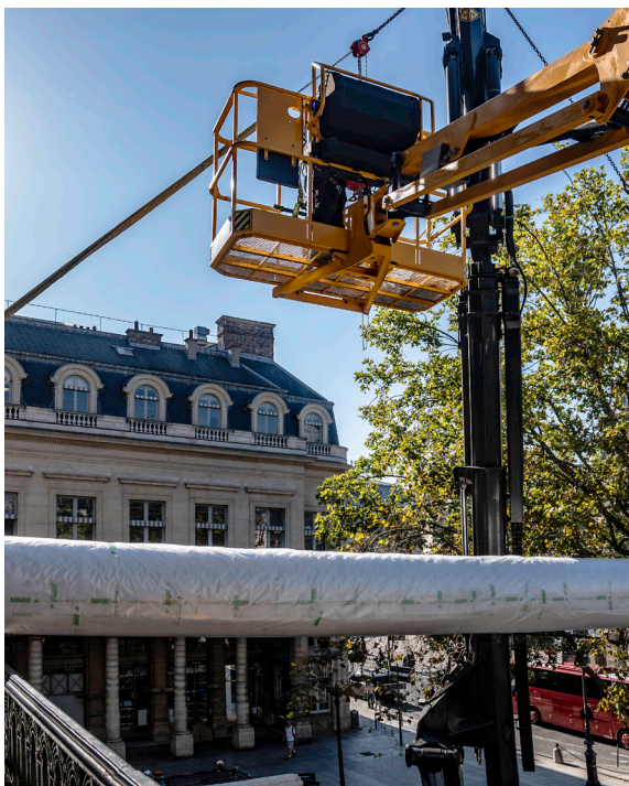
Le rideau, roulé sur un tube, passe une des fenêtres de la Comédie-Française grâce à une grue.

Un film sur ce projet d'envergure produit par le Cnap sera prochainement diffusé.