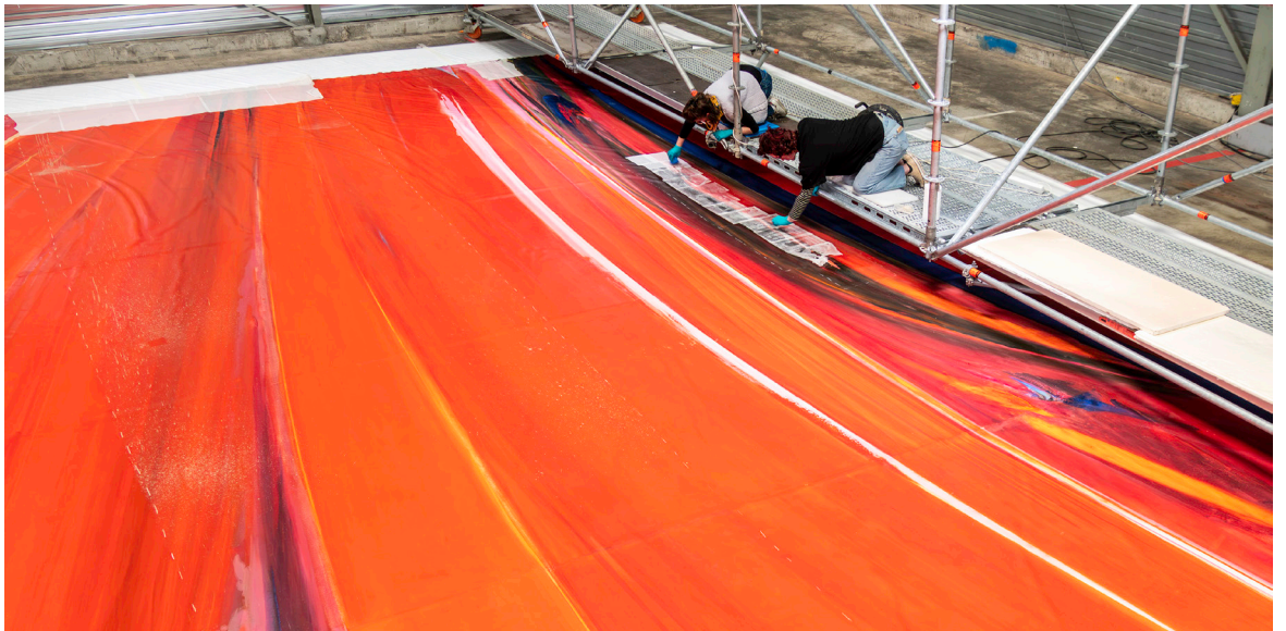
Retrait des facing collage réversible d'un papier de protection sur la couche picturale pour protéger et maintenir les soulèvements et les déchirures pendant les manipulations du rideau.