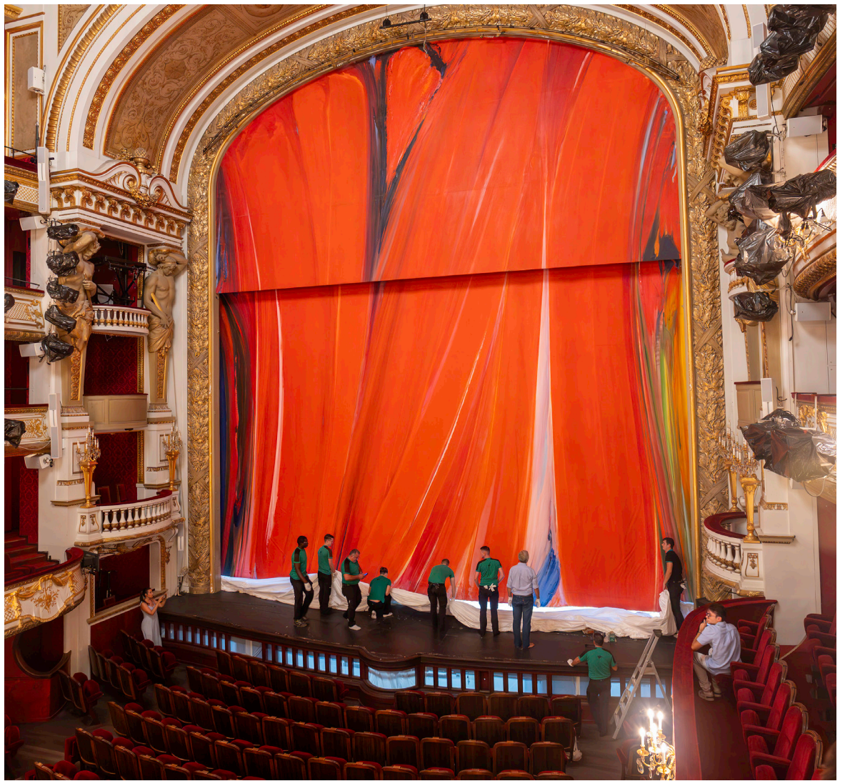
Le rideau réinstallé dans la salle Richelieu.