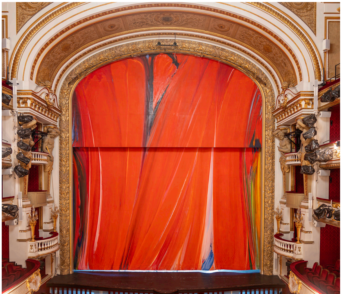
Le rideau réinstallé dans la salle Richelieu.

Plus de trente-cinq ans après avoir été dévoilé au public pour la première fois, le rideau de scène d'Olivier Debré pour la Comédie-Française, restauré durant plusieurs mois, est de nouveau installé.